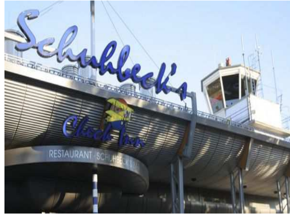
Restaurant Schuhbeck's Check Inn Flugplatz Egelsbach