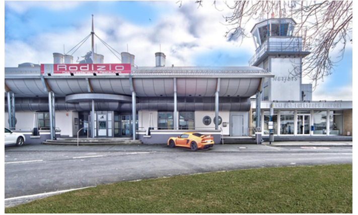
Flugplatz Egelsbach, Restaurant Rodizio