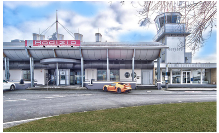
Flugplatz Egelsbach, Restaurant Rodizio